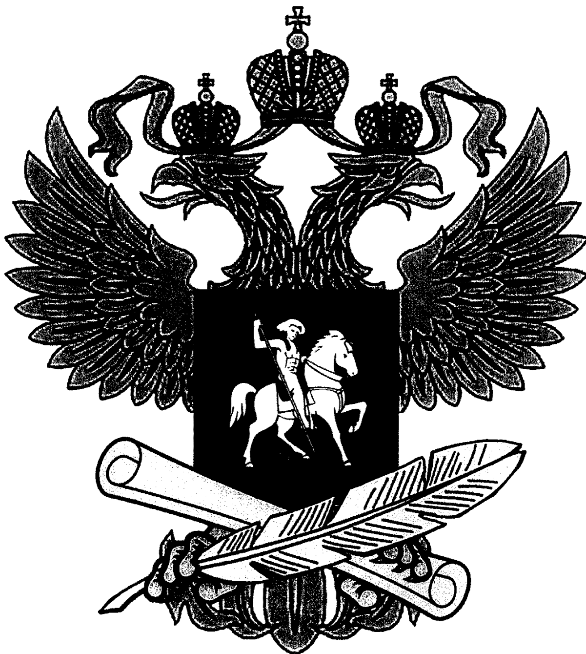
Рисунок геральдического знака - малой эмблемы Министерства образования и науки Российской Федерации